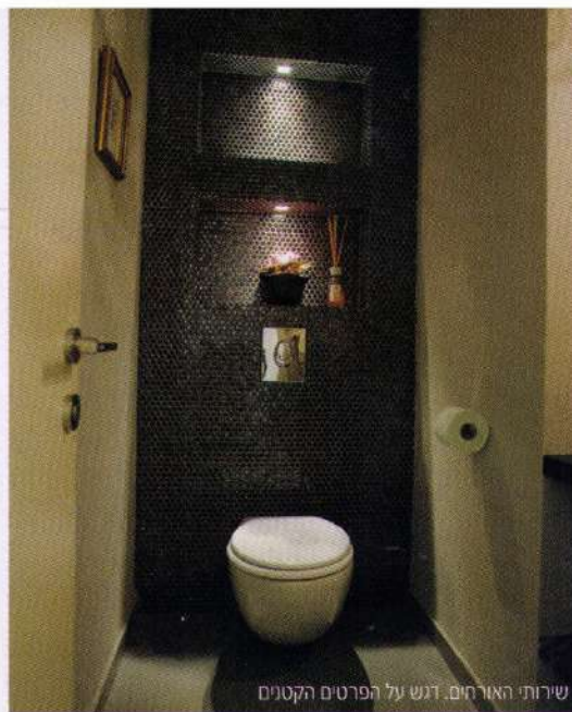
שירותי האורחים. דגש על הפרטים הקטנים

אופי הבית, "יש השואלים האם העבודה עוד לא נגמרה, והאם יש עוד גמר לקירות...".