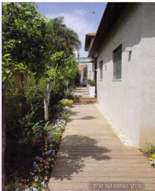
הדק הנמתח לצד הבית