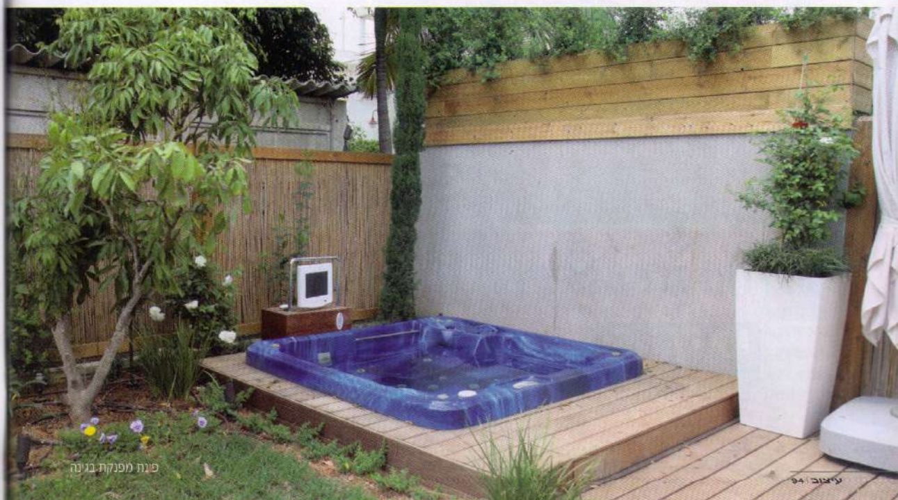
פינת מפנקת בנייה

האווירה בחלל נוצרת על ידי החומרים והתאורה, שילוב בין ריצוף אריחי גרניט פורצלן בגודל 60/60 ס"מ בגוון בטון, קירות צבעיים בגוון שמנת בהיר, ריהוט עץ אלון בגוון כהה, עם תאורת הלוגן שקועה בתקרה אשר יוצרת החוזר אור חמים מהקירות, ועוד. השימוש בחלונות בלגיים מפרופיל אלומיניום בגוון אפור כהה, בשילוב טיח חוץ "וונגה" אפור-בטון, יוצר את