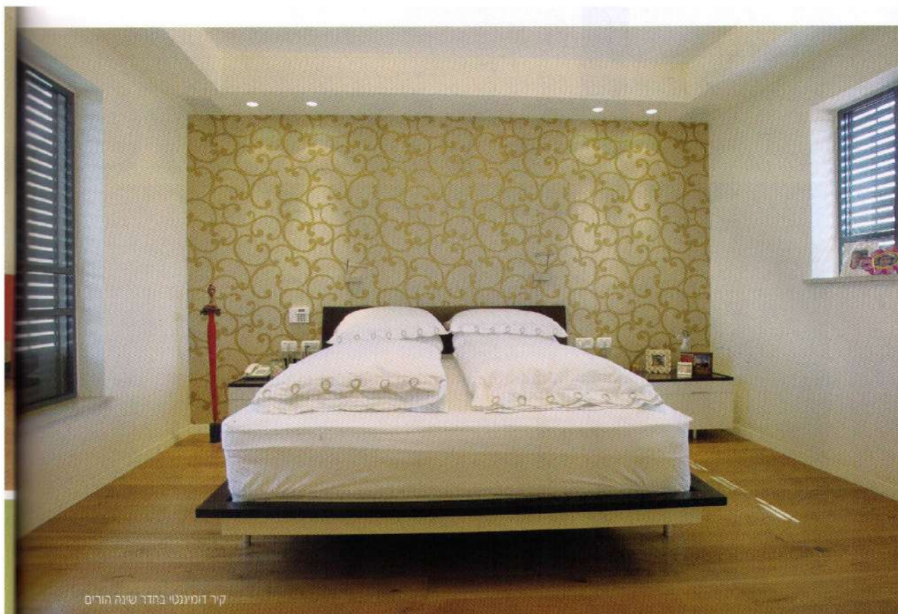
קר דומיננטי במדר שינה הורים